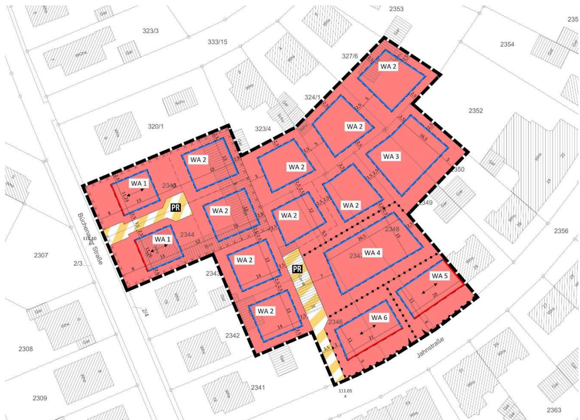
Bild 1: Bebauungsplan „Auf das Dorf - Nachverdichtung Büchenauer Straße/Jahnstraße“ (2022)

An der Büchenauer Straße bzw. der Jahnstraße befindet sich ein historisch entstandenes gewerbliches Areal. Nach Aufgabe dieser Nutzung lag der Gemeinde die Anfrage vor, dieses Areal für eine Wohnbebauung umzunutzen. Hierfür wurde ein städtebauliches Konzept mit Einfamilien- und Mehrfamilienhäusern entwickelt, welche über zwei Stichstraßen erschlossen werden sollen. Zur planungsrechtlichen Absicherung wurde auf dieser Grundlage 2019 der Aufstellungsbeschluss für den Bebauungsplan „Auf das Dorf - Nachverdichtung Büchenauer Straße/Jahnstraße“ gefasst. Seit 2022 besitzt der Bebauungsplan Rechtsgültigkeit.