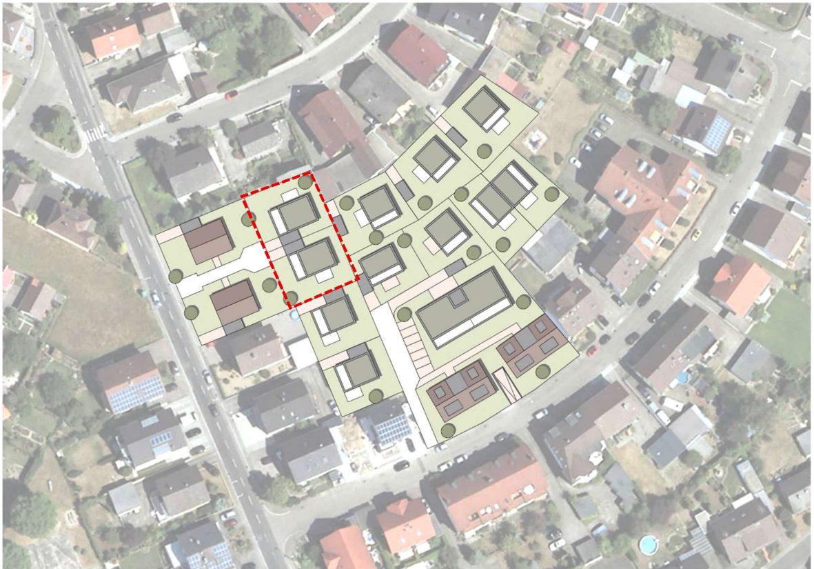
Bild 4: Bebauungskonzept (2022) mit Bereich der geplanten Grundstücksvereinigung (rot)