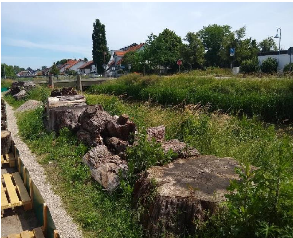
Abbildung 51: Mauereidechsen-Ersatzhabitat