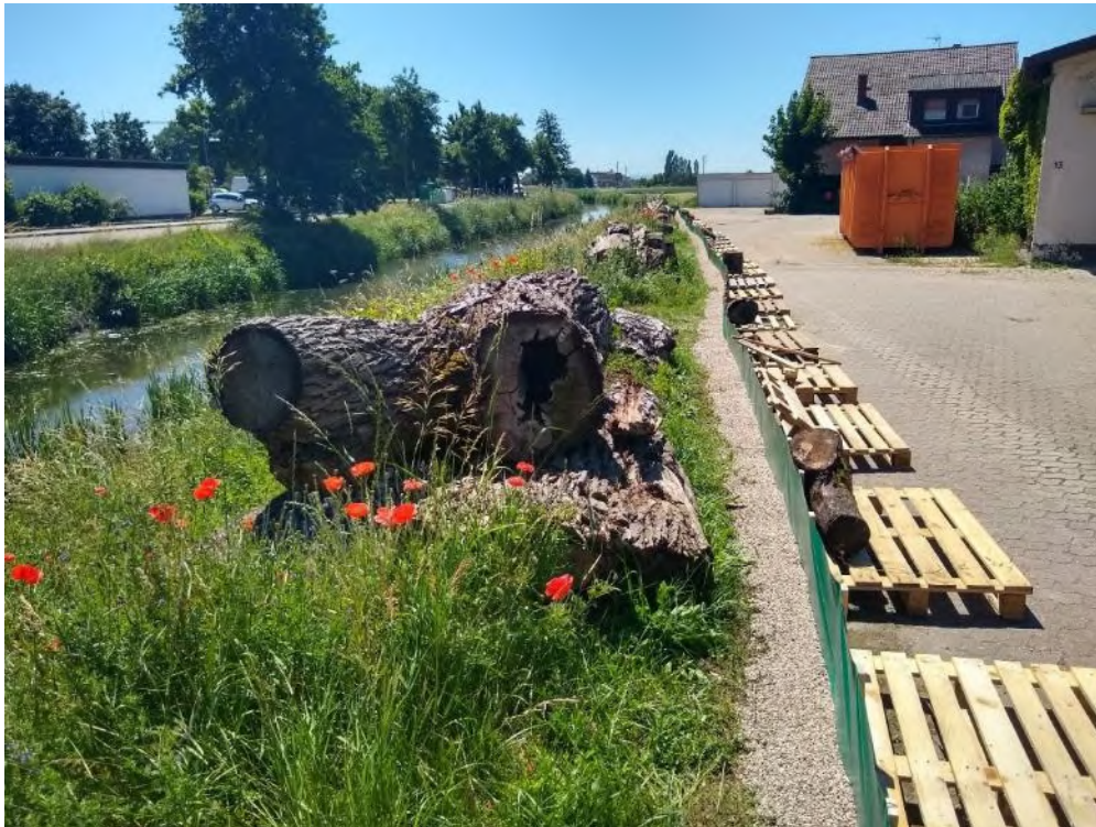
Abbildung 53: Mauereidechsen-Ersatzhabitate mit Schutzzaun