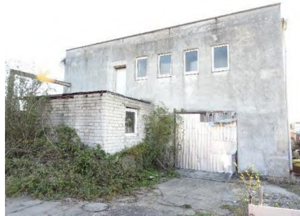
Abbildung 12: Abrissgebäude J