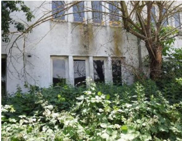
Abbildung 25: Ruderalfläche und Weide nördlich des Abrissgebäudes J