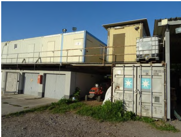
Abbildung 22: Abrissgebäude L