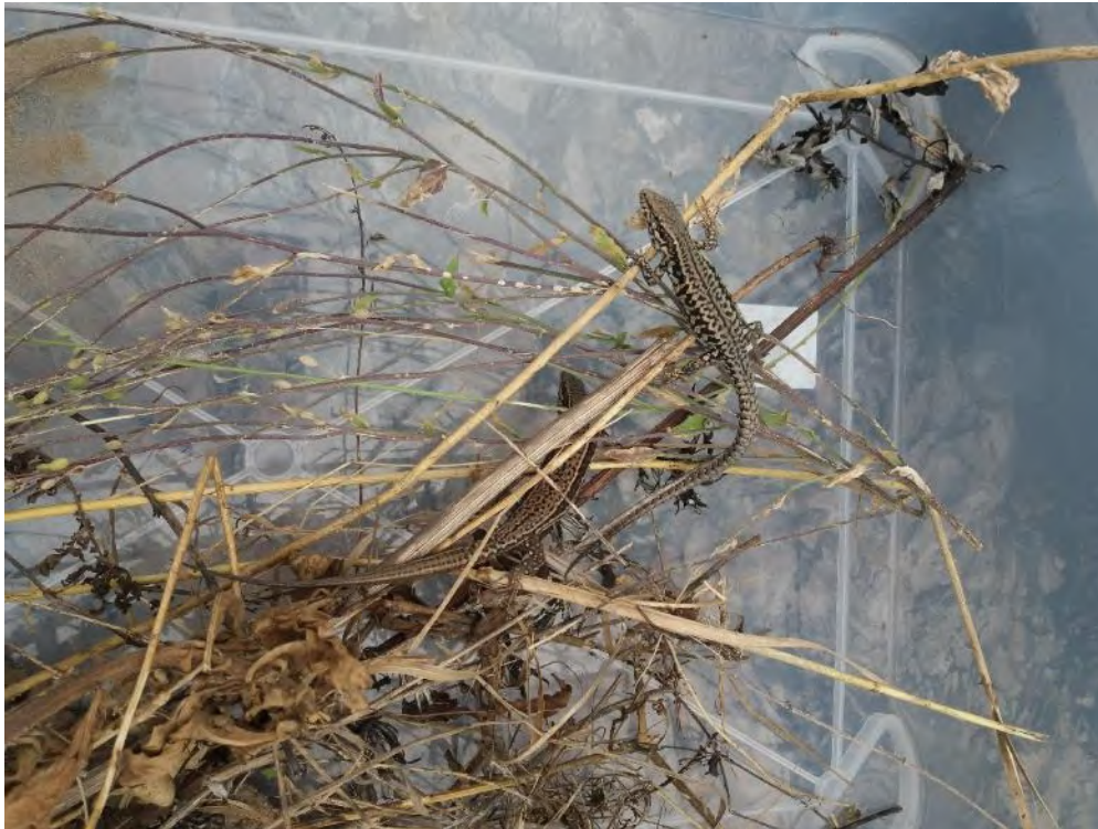
Abbildung 55: Gefangene Mauereidechsen vor der Umsiedlung aus dem Baufeld in die Ersatzhabitats