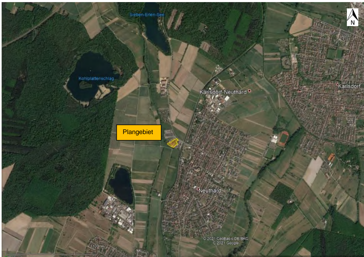
Abbildung 1: Lage des Plangebietes in Karlsdorf-Neuthard

Das Plangebiet (Abbildung 1) liegt in der Hardtebene im Norden der Großlandschaft Oberrheinisches Tiefland, welche überwiegend von sandig-kiesigem Niederterrassenschottern aufgebaut und mit einer Schicht aus kalkigem Flugsand überdeckt ist.