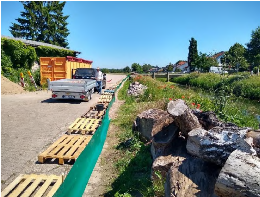
Abbildung 52: Erstellung des Reptilienschutzzaunes um die Mauereidechsen-Ersatzhabitate

Vor der eigentlichen Umsiedlung der Mauereidechsen in die Ersatzhabitate wurde dieser Bereich am 14. Juni 2021 mit einem Reptilienschutzzaun gesichert (Abbildung 52 und Abbildung 53). Dadurch soll unterbunden werden, dass die Reptilien (Mauereidechsen) in den Baustellenbereich bzw. die Baunebenflächen einwandern/ eindringen. Diese konfliktvermeidende Maßnahme in Bezug auf das Tötungs- und Verletzungsverbot wurde vor Beginn der eigentlichen Baumaßnahmen durchgeführt. Der Schutzzaun muss bis Abschluss der Bauarbeiten bestehen bleiben.