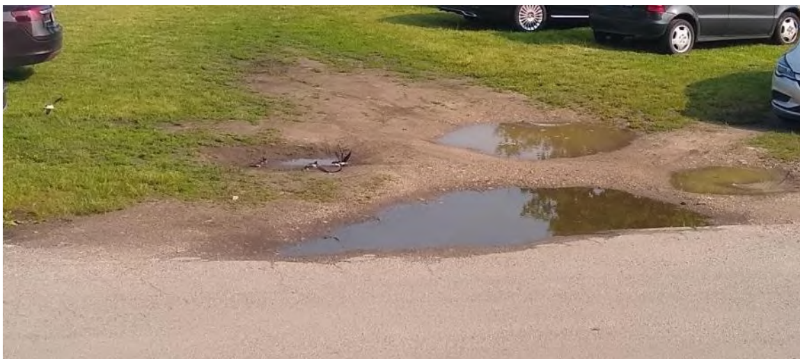
Abbildung 48: Pfützen auf dem unbefestigten Parkplatz, die von Mehlschwalben aufgesucht werden

Die Mehlschwalbe benötigt für den Bau ihrer Nester feuchte Pfützen/ Flachgewässer mit offenem Boden (Lehm, Schlamm, Erde). Der Erhalt von wasserführenden Pfützen während dem Nestbau ist notwendig (Abbildung 48). Diese können auf dem Eingriffsgebiet oder auf dem nördlich angrenzenden Flurstück liegen. Ein ausreichender Abstand zu potenziellen Stör- und Gefahrenquellen und ein freier Anflug ohne Gefährdung muss für die Tiere sichergestellt werden.