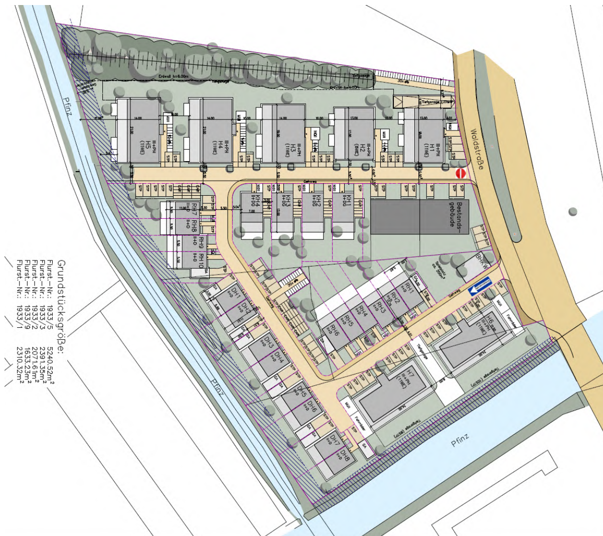
Abbildung 5: Lageplanentwurf Wohnbebauung