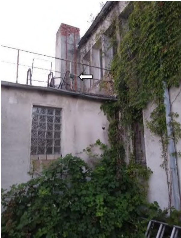
Abbildung 35: Song Meter am Abrissgebäude J