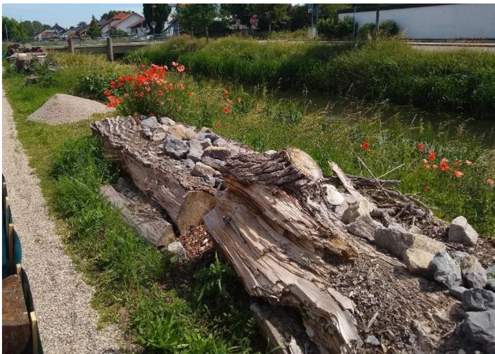
Abbildung 49: Mauereidechsen-Ersatzhabitat mit Fortpflanzungs- und Ruhestätten

Im Juni 2021 wurden zwischen den Totholzstämmen Sandkieshaufen aufgeschüttet sowie die Ruderalflächen stellenweise runtergemäht und das Material zur Aushagerung der Fläche zu lockeren Haufen aufgeschichtet. Die Altgrashaufen können als Versteckmöglichkeiten dienen. Die Ersatzhabitate können folglich als ökologisch funktionsfähig eingestuft werden und weisen mit den Totholz-, Stein-, Sand- und Ruderalflächen ein vielfältiges Angebot an Strukturen und sonnenexponierten Substraten auf, die von den Reptilien, insbesondere der Mauereidechse, als Winterquartiere, Sonn- und Balzplätze, Eiablageplätze dienen und zur Nahrungssuche genutzt werden können (Abbildung 49 bis Abbildung 51).