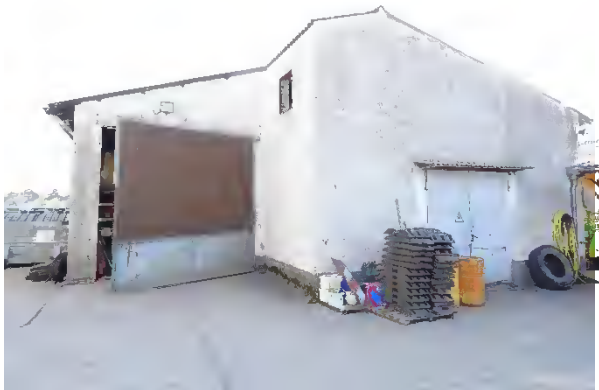
Abbildung 8: Abrissgebäude H