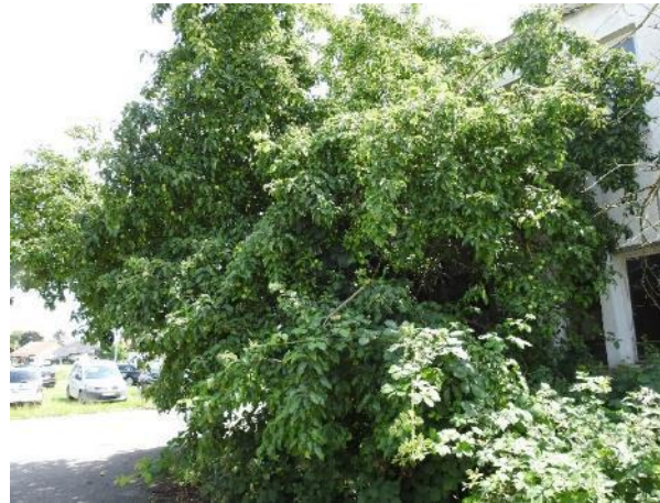
Abbildung 28: Obstbaum nördlich des Ab- rissgebäudes J