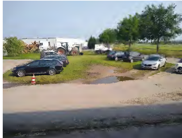
Abbildung 26: Unversiegelter Parkplatz