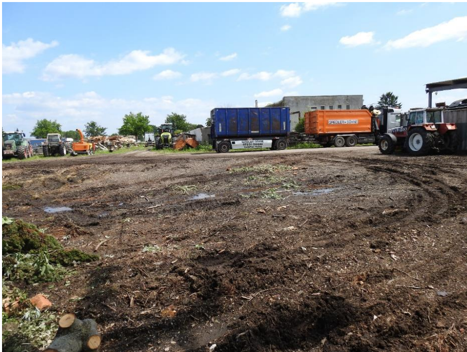
Abbildung 36: Blick auf die Freifläche östlich der Alten Pfinz

Im Untersuchungsjahr 2021 konnte eine intensive Jagdaktivität von Zwerg- und Breitflügelfledermaus mit einem Schwerpunkt auf den freien Flächen im nordwestlichen Bereich des Plangebietes nahe der Alten Pfinz und auf der nördlich angrenzenden Holzlagerfläche außerhalb des Plangebietes (Flurstück-Nr. 1933/10) bei der abendlichen Begehung am 21.06.2021 sowie in den frühen Morgenstunden am 07. & 21.07.2021 beobachtet werden (Abbildung 36). Auf den Freiflächen wurden bei den Schwarmkontrollen am 07. & 21.07.2021 bis zu vier Individuen der Zwergfledermaus und bis zu drei Individuen der Breitflügelfledermaus in den frühen Morgenstunden ab etwa 04:45 Uhr gleichzeitig jagend gesichtet. Am 07.07.2021 flogen drei Breitflügelfledermäuse sowie vier Zwergfledermäuse zielgerichtet zur genannten Zeit aus südöstlicher Richtung ein, um anschließend für knapp eine halbe Stunde über den Freiflächen zu jagen.