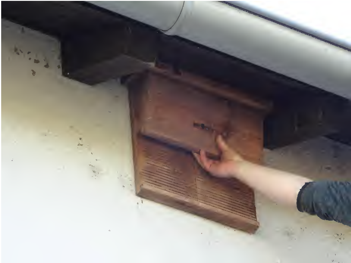
Abbildung 46: Fledermausflachkasten am Bestandsgebäude