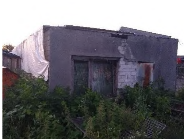
Abbildung 20: Abrissgebäude K (westliche Garage)