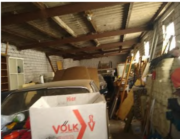
Abbildung 19: Abrissgebäude K