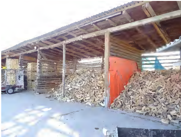
Abbildung 42: Abrissgebäude I