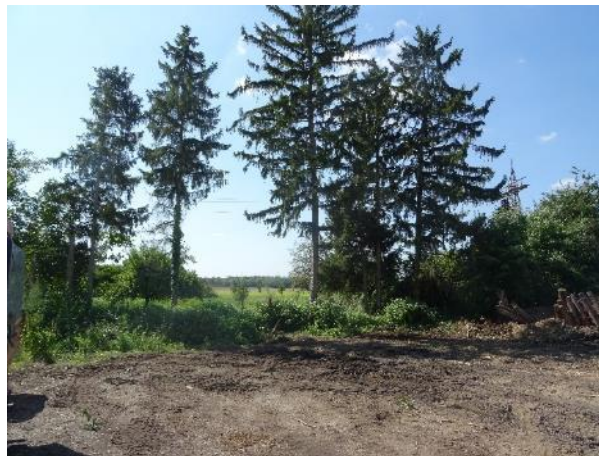
Abbildung 30: Fichtenbestand entlang der al- ten Pfinz