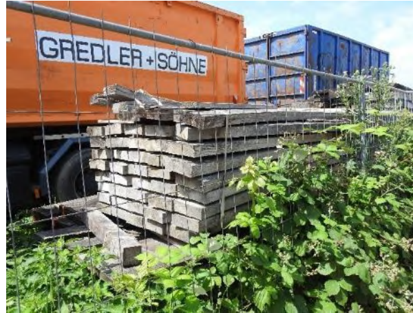
Abbildung 24: Holzstapel