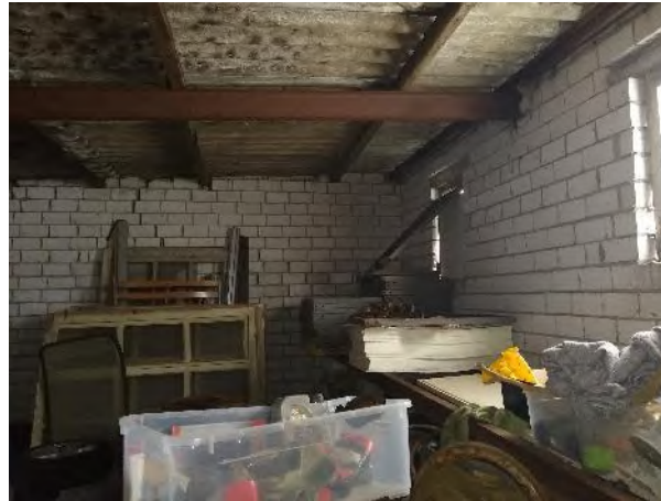
Abbildung 18: Abrissgebäude K