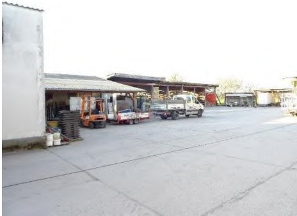
Abbildung 9: Abrissgebäude I