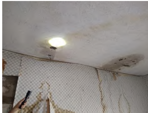
Abbildung 32: Inspektion/Überprüfung potenzieller Fledermausquartiere mittels starker Taschenlampe