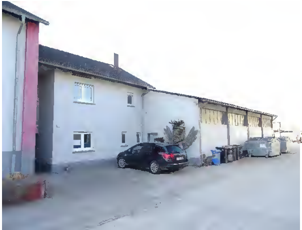
Abbildung 6: Abrissgebäude H

Das Obergeschoß steht größtenteils leer und lediglich ein Raum wird zur Lagerung von Materialien genutzt, sodass dieses insgesamt sehr wenig von Menschen frequentiert wird (Abbildung 11 - Abbildung 16). Bei dem Abrissgebäude K handelt es sich um einen Garagenkomplex, der als Werkstatt und Stell-/ Lagerfläche genutzt wird (Abbildung 17 - Abbildung 21). Die Container und Lagerhalle nahe der Alten Pfinz (Abrissgebäude L) unterliegen der gewerblichen Nutzung durch Bedienstete der Firma Gredler und Söhne GmbH (Abbildung 22).