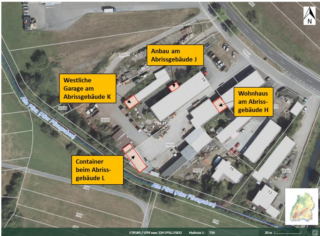
Abbildung 34: Unzugängliche Gebäudebereiche

Quelle: Daten- und Kartendienst der LUBW ( https://udo.lubw.baden-wuerttemberg.de/public/ ; 03.09.2021); modifiziert