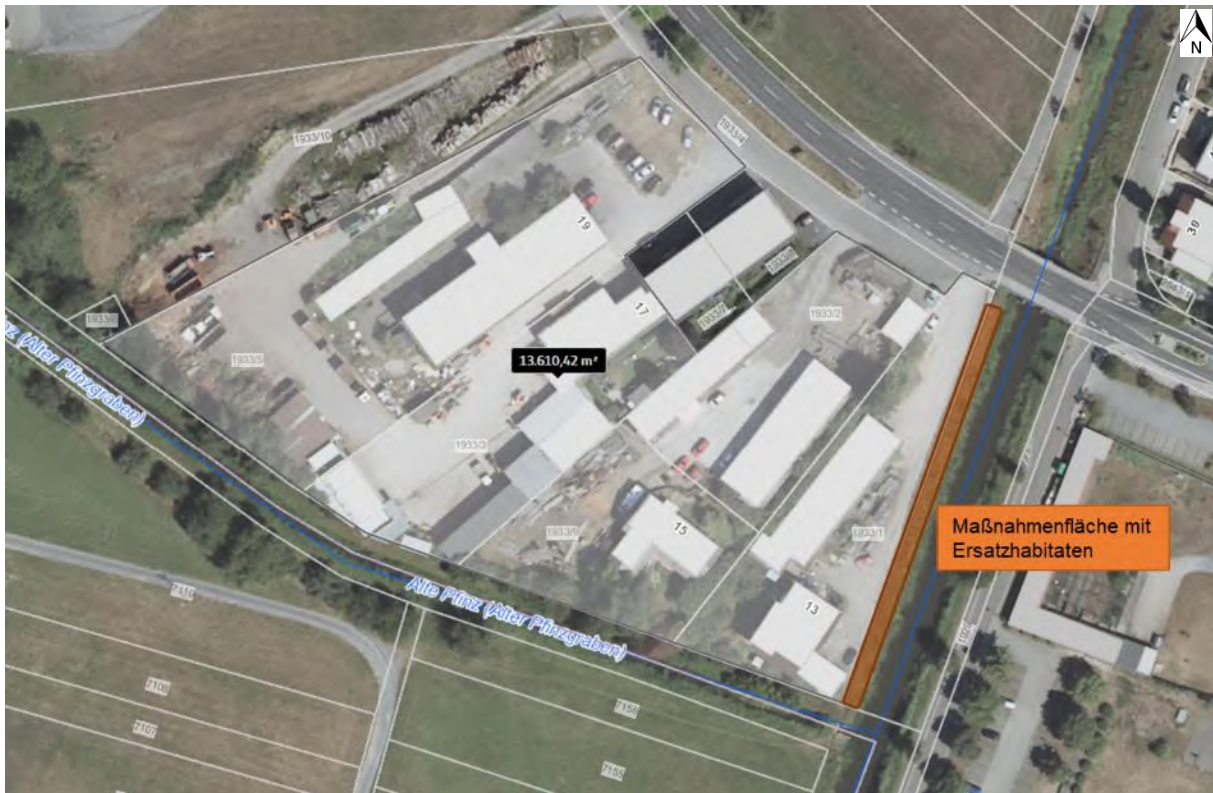
Abbildung 54: Lage des geplanten Baufeldes/ der Baufeldnebenflächen (grau hinterlegt) und der Maßnahmenfläche mit den Ersatzhabitaten für die Mauereidechse