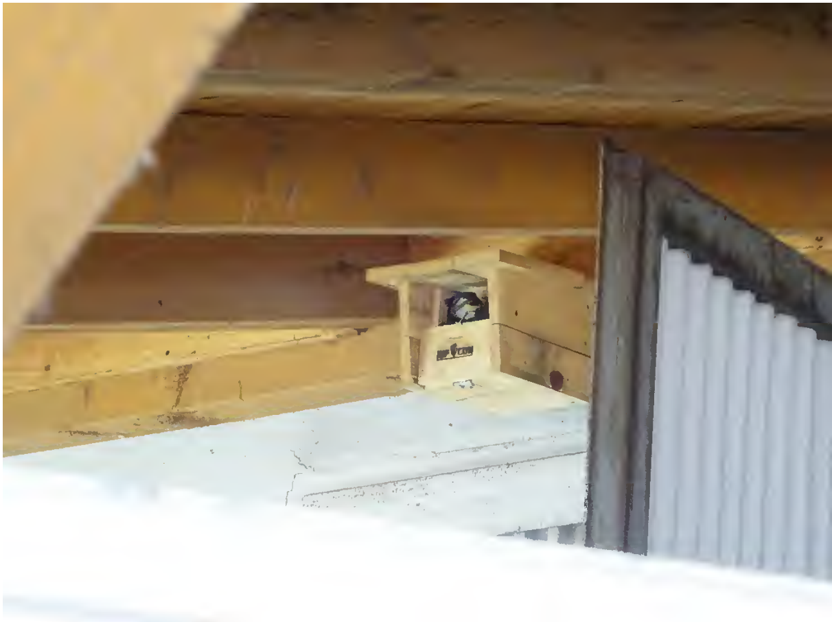
Abbildung 47: Halbhöhlenkasten mit Hausrotschwanzbrut

Für die ebenfalls vom Bauvorhaben direkt betroffene Gebäudebrüterart Star soll ein weiterer Nistkasten (z.B. „Starenhöhle 3S 45 mm“ von Schwegler) an geeigneter, von den Baumaßnahmen nicht betroffener Stelle, vor Beginn der Brutsaison erfolgen. Die Maßnahme kann direkt in den Herbst- und Wintermonaten 2021/ 2022 durchgeführt werden und ist zwingend erforderlich. Darüber hinaus wird empfohlen weitere Nistkästen für gebäudebrütende Vogelarten zu einem späteren Zeitpunkt an den Neubauten/ im geplanten Wohngebiet zu errichten.