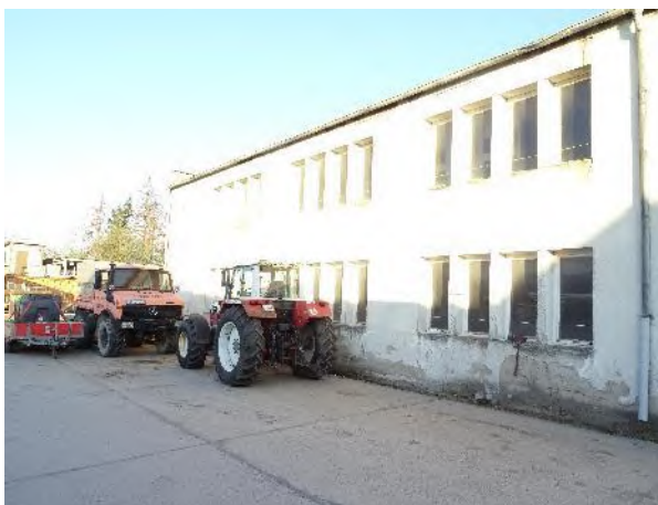
Abbildung 13: Abrissgebäude J