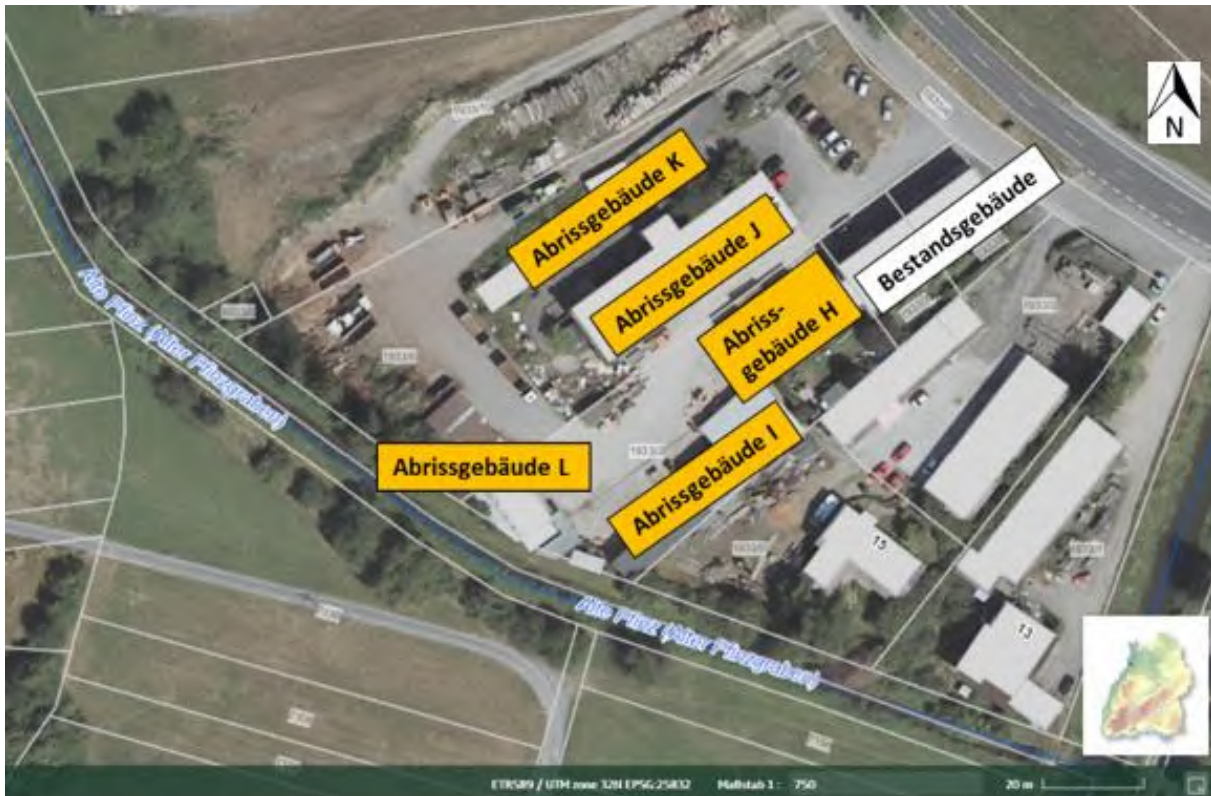
Abbildung 3: Abrissgebäude H- L innerhalb des Plangebietes