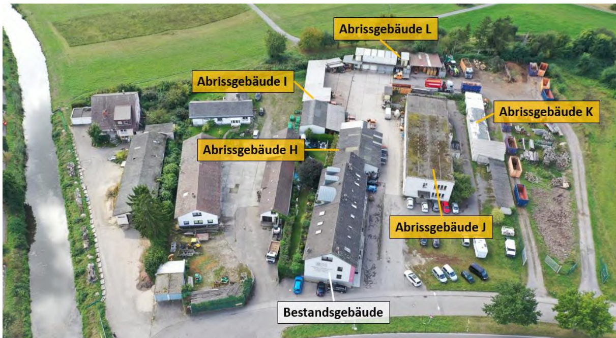
Abbildung 4: Luftaufnahme der Abrissgebäude H- L innerhalb des Plangebietes