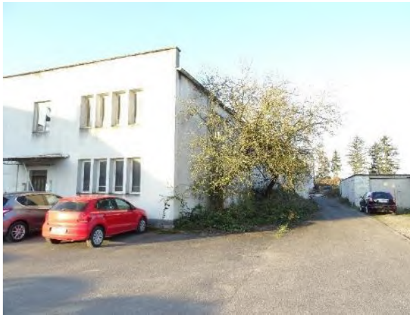
Abbildung 11: Abrissgebäude J