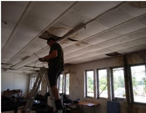
Abbildung 31: Inspektion/Überprüfung potenzieller Fledermausquartiere mittels Endoskop