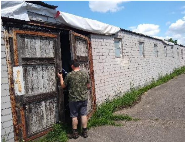
Abbildung 17: Abrissgebäude K