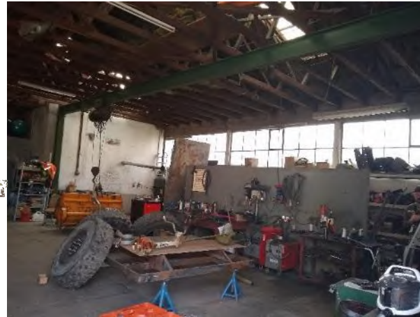
Abbildung 7: Abrissgebäude H mit Werkstatt