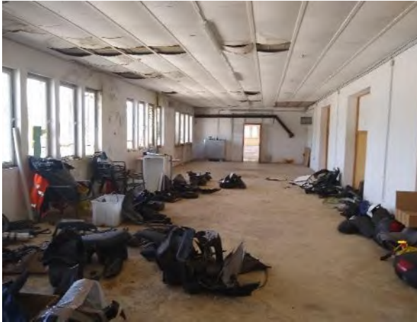
Abbildung 15: Abrissgebäude J