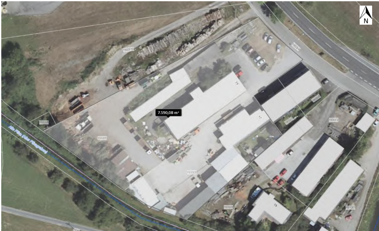
Abbildung 2: Übersichtskarte des Plangebietes (grau hinterlegt)

Abbildung 5 zeigt den Entwurf zur Wohnbebauung auf dem Plangebiet sowie auf den südöstlich angrenzenden Flurstücken Nr. 1933/1, 1933/2 und 1933/9. Die notwendige saP für die Flurstücke 1933/1, 1933/2 und 1933/9 erfolgte bereits in 2020 durch die RIFCON GmbH (RIFCON Report 2040036 - „Spezielle artenschutzrechtliche Prüfung (saP) und ökologische Baubegleitung zum Wohnpark Waldstraße in Karlsdorf-Neuthard“).