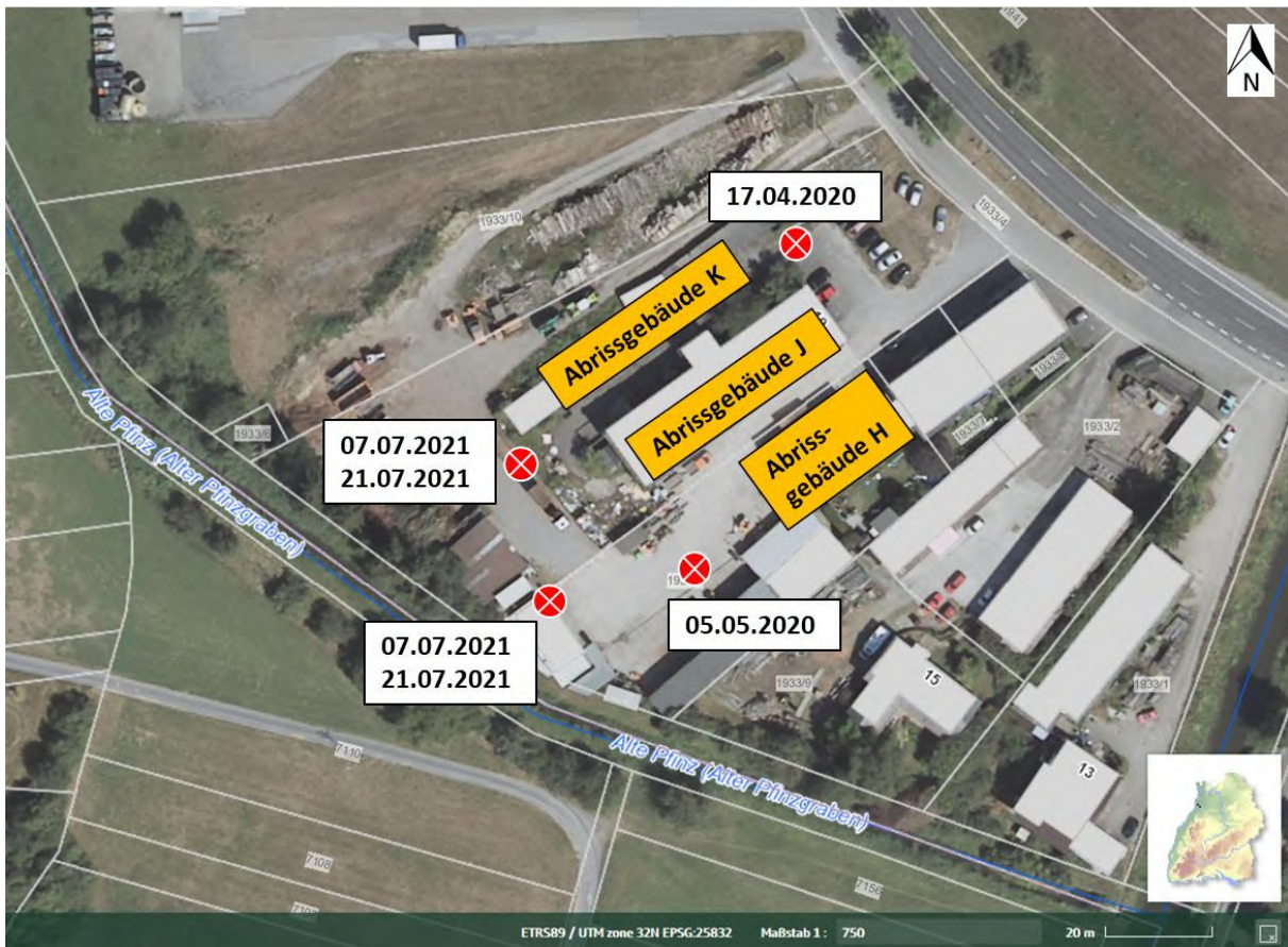
Abbildung 33: Beobachtungspunkte zur Erfassung potenzieller Quartiermöglichkeiten und Ausflügen von Fledermäusen am Gebäude K , J und H