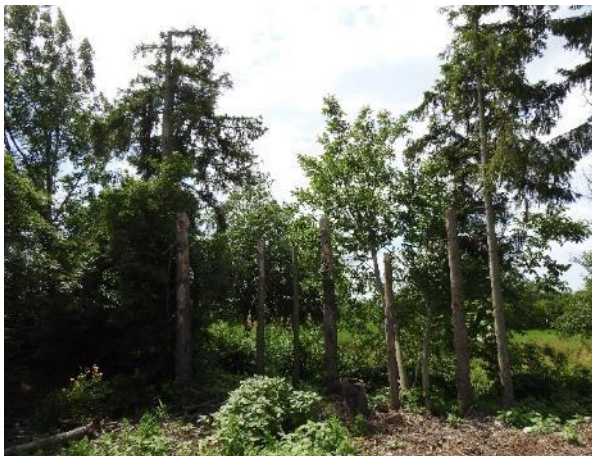
Abbildung 29: Fichtenbestand entlang der al- ten Pfinz