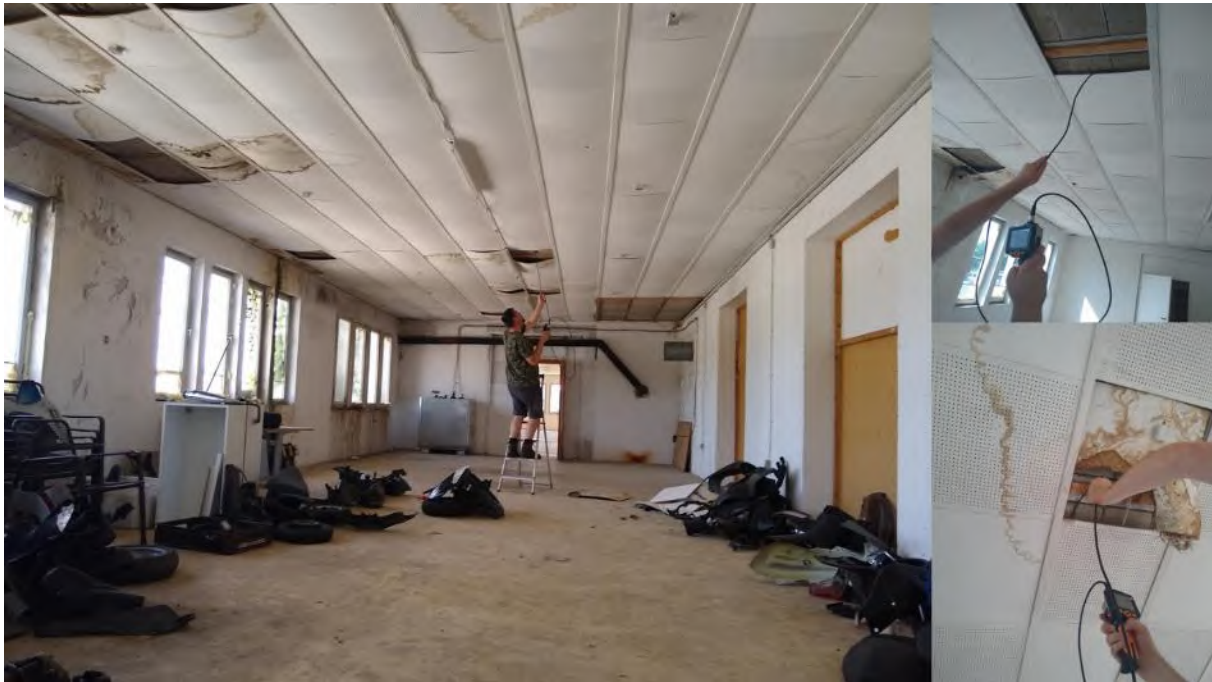
Abbildung 40: Gebäude J mit hohem Quartierpotenzial im Bereich der Decken