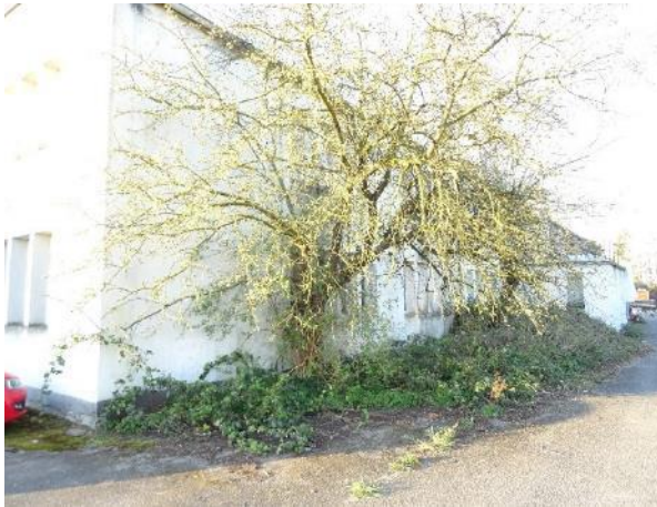
Abbildung 27: Obstbaum nördlich des Ab- rissgebäudes J