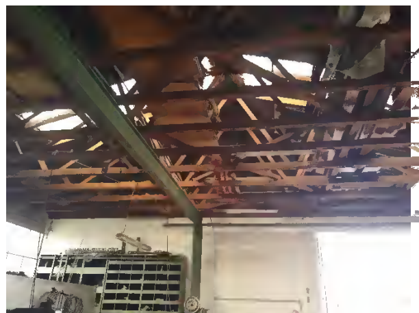
Abbildung 38: Abrissgebäude H