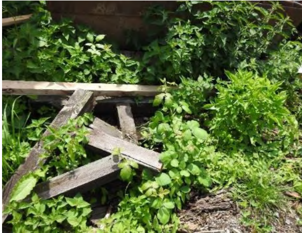
Abbildung 23: Altholz