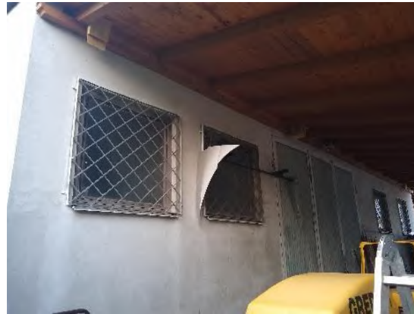
Abbildung 10: Abrissgebäude I