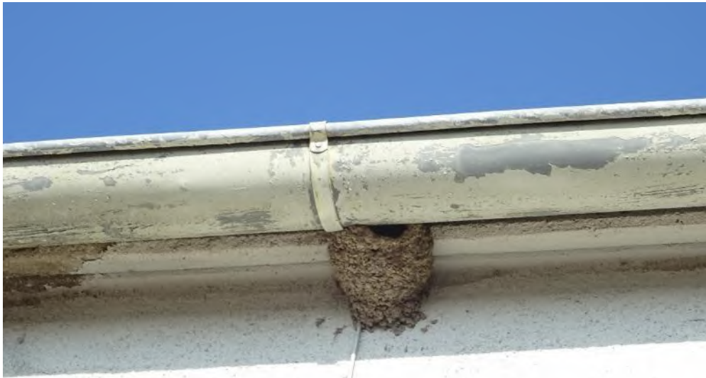
Abbildung 43: Mehlschwalbennest am Abrissgebäude J