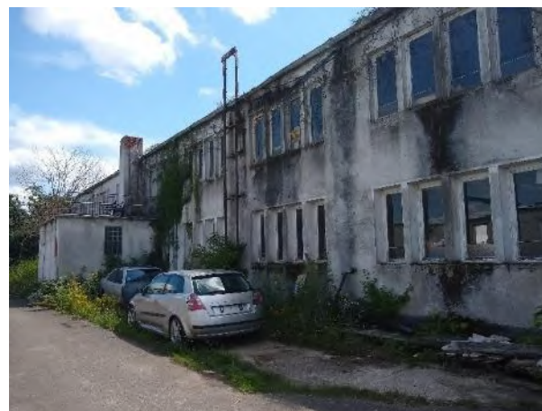
Abbildung 14: Abrissgebäude J