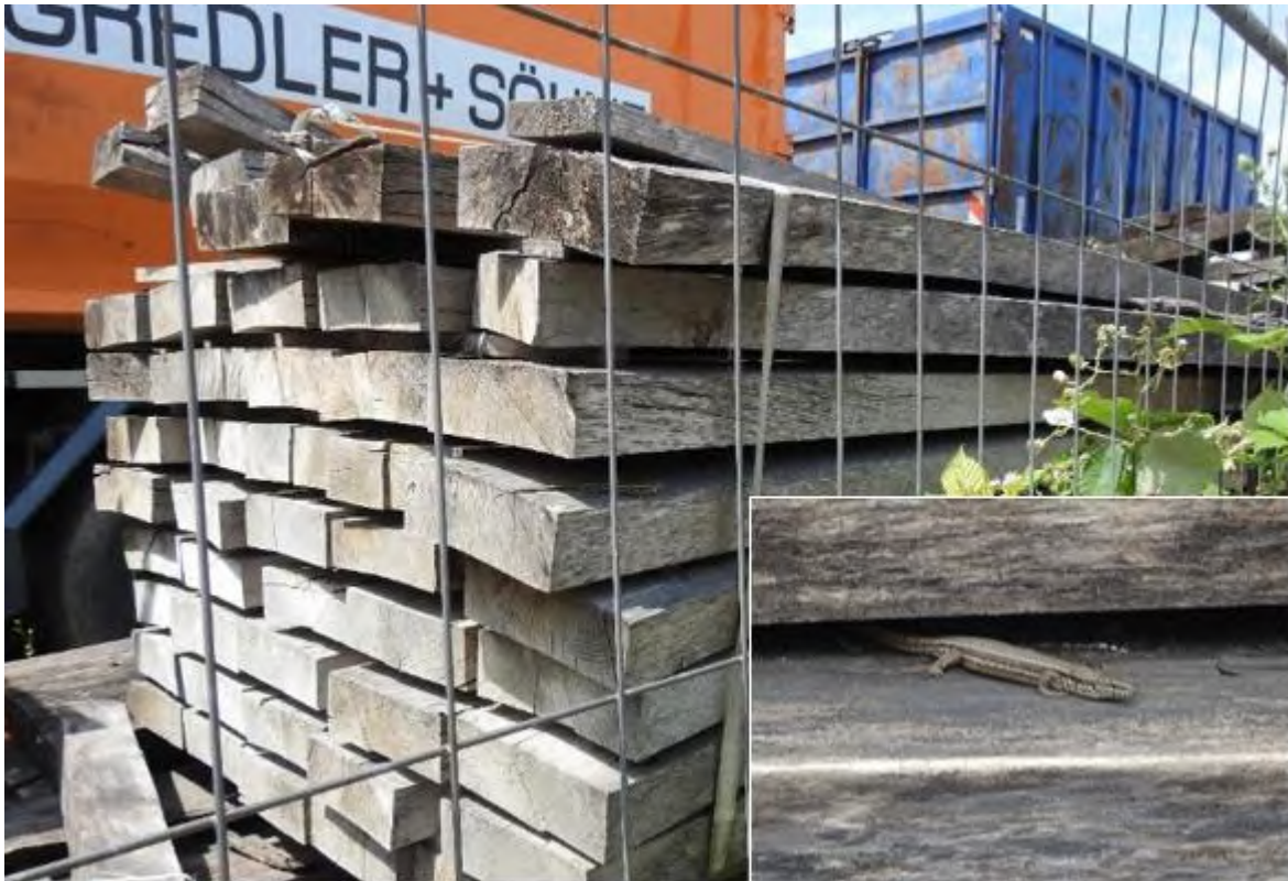
Abbildung 45: Mauereidechse auf Holzstapel