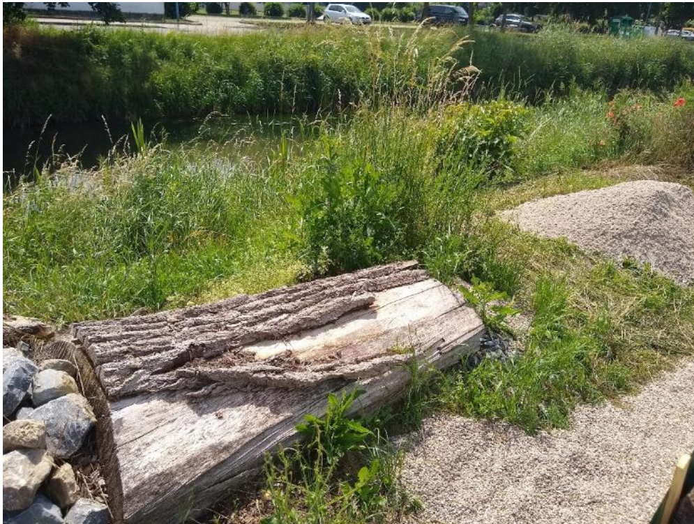
Abbildung 50: Mauereidechsen-Ersatzhabitat