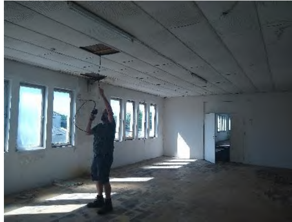
Abbildung 16: Abrissgebäude J