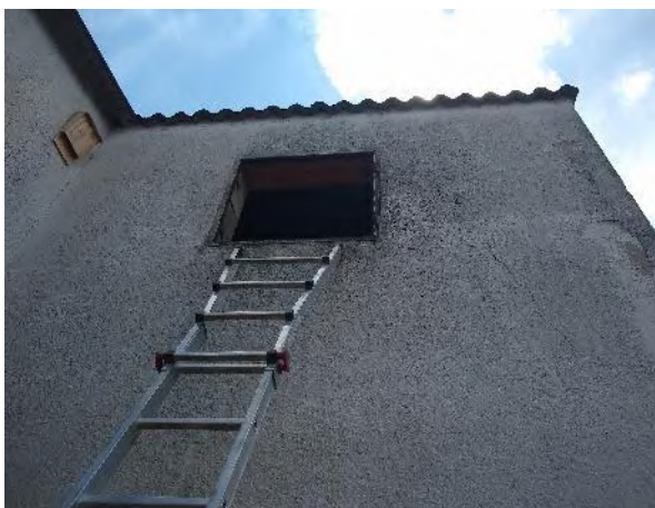
Abbildung 37: Abrissgebäude H (Anbau an der Werkstatt)

Im Plangebiet befinden sich das Abrissgebäude H , welche als Wohngebäude mit Werkstatt dienen und funktionell sehr gut erhalten sind. Das Dach ist als Satteldach errichtet. Bei dem Wohnhaus handelt es sich um einen intakten, gut erhaltenen Wohntrakt; die Innenräume des Wohnhauses werden aktuell noch genutzt und konnten nicht untersucht werden. Die Werkstatt weist mit der Dachkonstruktion und dem Anbau ein hohes Potential auf (Abbildung 6 - Abbildung 8, Abbildung 37 & Abbildung 38); allerdings konnten keine Kotnachweise und potenzielle Quartiere in der Werkstatt sowie dessen Anbau nachgewiesen werden. Eine Eignung als Winterquartier (frost- und zugfrei, hohe Luftfeuchtigkeit) scheidet aufgrund der baulichen Begebenheit eher aus, kann aber nicht vollständig ausgeschlossen werden. Insgesamt weist das Gebäude ein hohes Quartierpotential 1 auf.