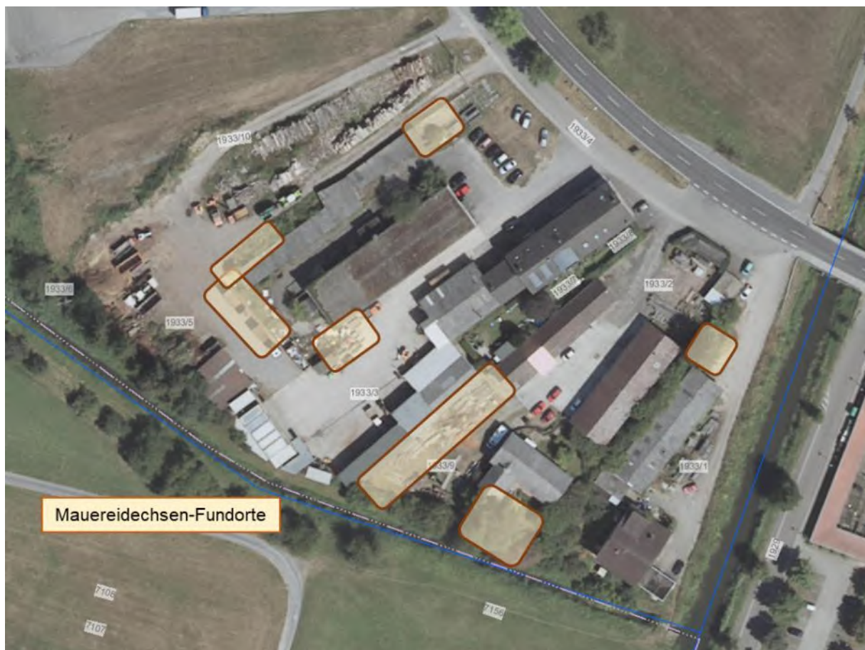
Abbildung 44: Lage der Mauereidechsen-Fundorte im Plangebiet sowie auf den südlich angrenzenden Flurstücken

5 Schutzstatus nach BNatSchG: b = besonders geschützte Art; s = streng geschützte Art