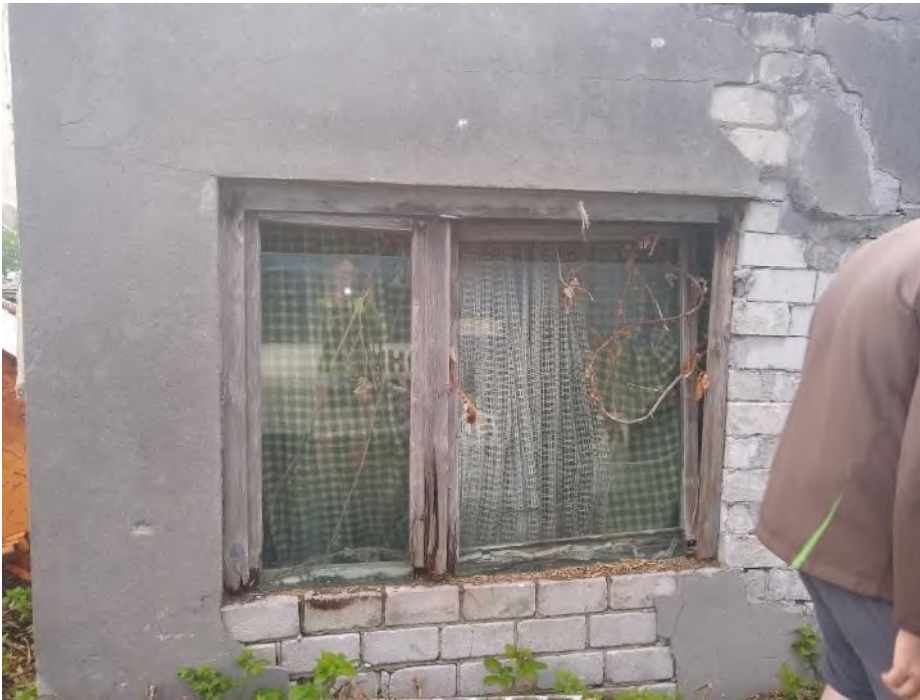
Abbildung 41: Gebäude K mit mittlerem Quartierpotenzial