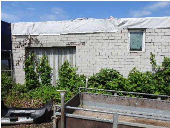
Abbildung 21: Abrissgebäude K (westliche Garage)